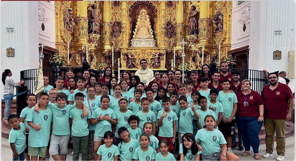
Archivo de Hermandad

Cada aportación, sin importar su tamaño, sigue siendo fundamental para que nuestra hermandad continúe creciendo y evolucionando, y para que podamos llevar a cabo actividades tan importantes como las Colonias de Verano. Este proyecto es un reflejo del esfuerzo y el cariño que nuestra Hermandad pone en cada uno de los eventos que organiza, especialmente aquellos destinados a nuestros más pequeños, que son el futuro de nuestra corporación. Como Diputada de Juventud, quiero agradecer profundamente a todos aquellos que, con su dedicación y compromiso, hacen posible que los sueños de nuestros niños sigan siendo una realidad.