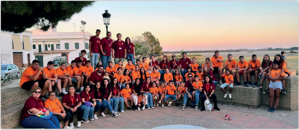
Archivo de Hermandad

D urante todo el año seguimos trabajando para seguir aumentando nuestra fe y compromiso con nuestra Hermandad.